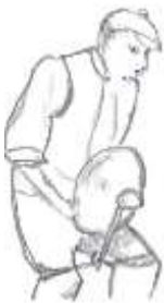
Figuur 1 Boemlala

Ieder metaal dat je ophangt en aantikt geeft geluid, vooral buizen. Je kan er een klokkenspel mee maken.