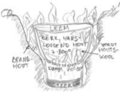
Figuur 160 Dubbele pot methode

De meeste Polycyclische Aromatische Koolwaterstoffen zijn zeer schadelijk: ze zijn giftig, kankerverwekkend en/of slecht afbreekbaar.