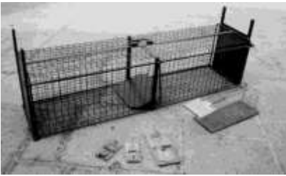
Figuur 97 Vallen

De larsenkooi en de trecherval zijn bestrijdingsmiddelen om eksters, kraaien en kauwen te vangen. Ze bestaan uit een gesloten kooi met een lokvogel, en 1 of meer compartimenten (trechteringang) waarin meerdere vogels gevangen kunnen worden.