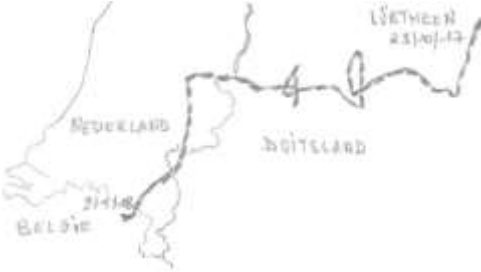
Figuur 84 Wolvenroute

Het Tv-programma 'Dieren in Nesten' kon in september 2011 beelden maken van een wolf bij Gedinne (Ardennen).