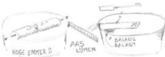
Figuur 78 Muizenravin

Je zou denken dat onze muizenval al eeuwen overal ter wereld gebruikt wordt. Mis. Rond 1845 vond Hiram Stevens Maxim de klapval met aas uit. En verwierf nog 271 andere patenten. Degelijk en eenvoudig bedacht, is het nog steeds een efficiënt ding.